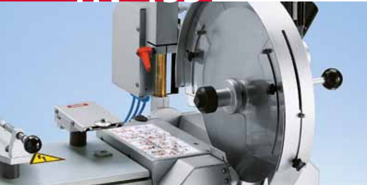
Kreismesser Ø 480 mm