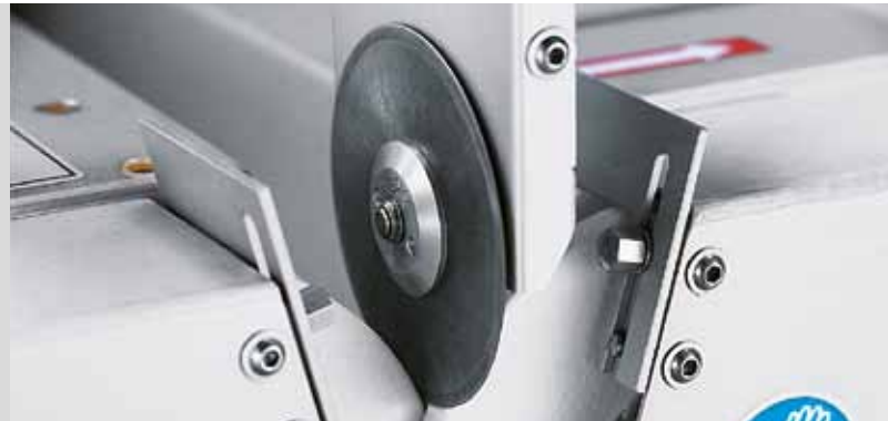
Kreismesser Ø 60 mm

Schärfe, Schneidenwinkel und Fasenbreite eines Kreismessers haben großen Einfluss auf die Qualität der geschnittenen Produkte.